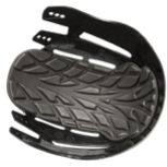
SCARAP2 : Coque semi pleine